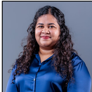
سُبْحَانَكَ يَا سُبْحَانَكَ سُبْحَانَكَ يَا سُبْحَانَكَ يَا سُبْحَانَكَ