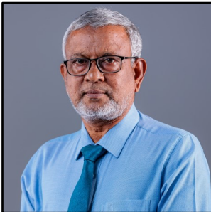
سُبْحَانَكَ يَا سُبْحَانَكَ سُبْحَانَكَ يَا سُبْحَانَكَ يَا سُبْحَانَكَ